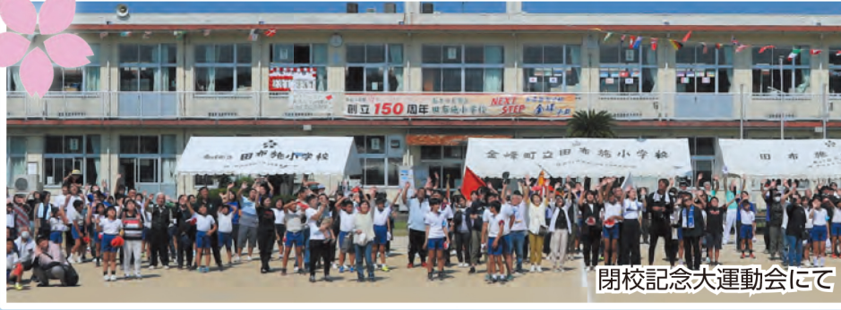
閉校記念大運動会にて