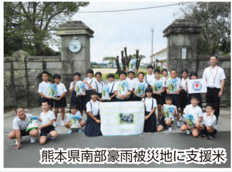
熊本県南部豪雨被災地に支援米