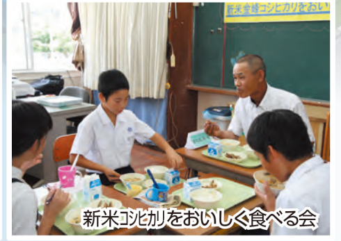
新米コヒカリをおいしく食べる会