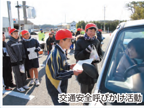
交通安全呼びかけ活動