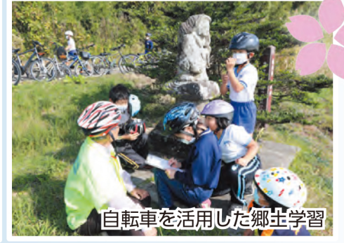
自転車を活用した郷土学習