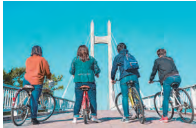
@y.sonycamera さん # サイクリング