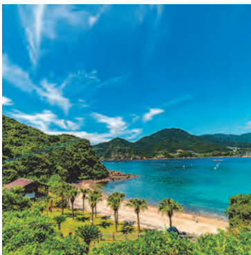
@joe315315 さん # 先荒所浜