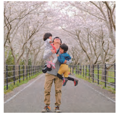
# りんりんロード