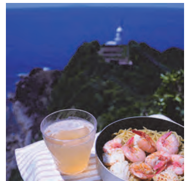
@tomimaru2019 さん # 坊ノ岬灯台