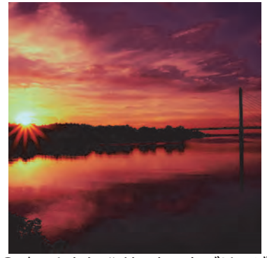
# サンセットブリッジ